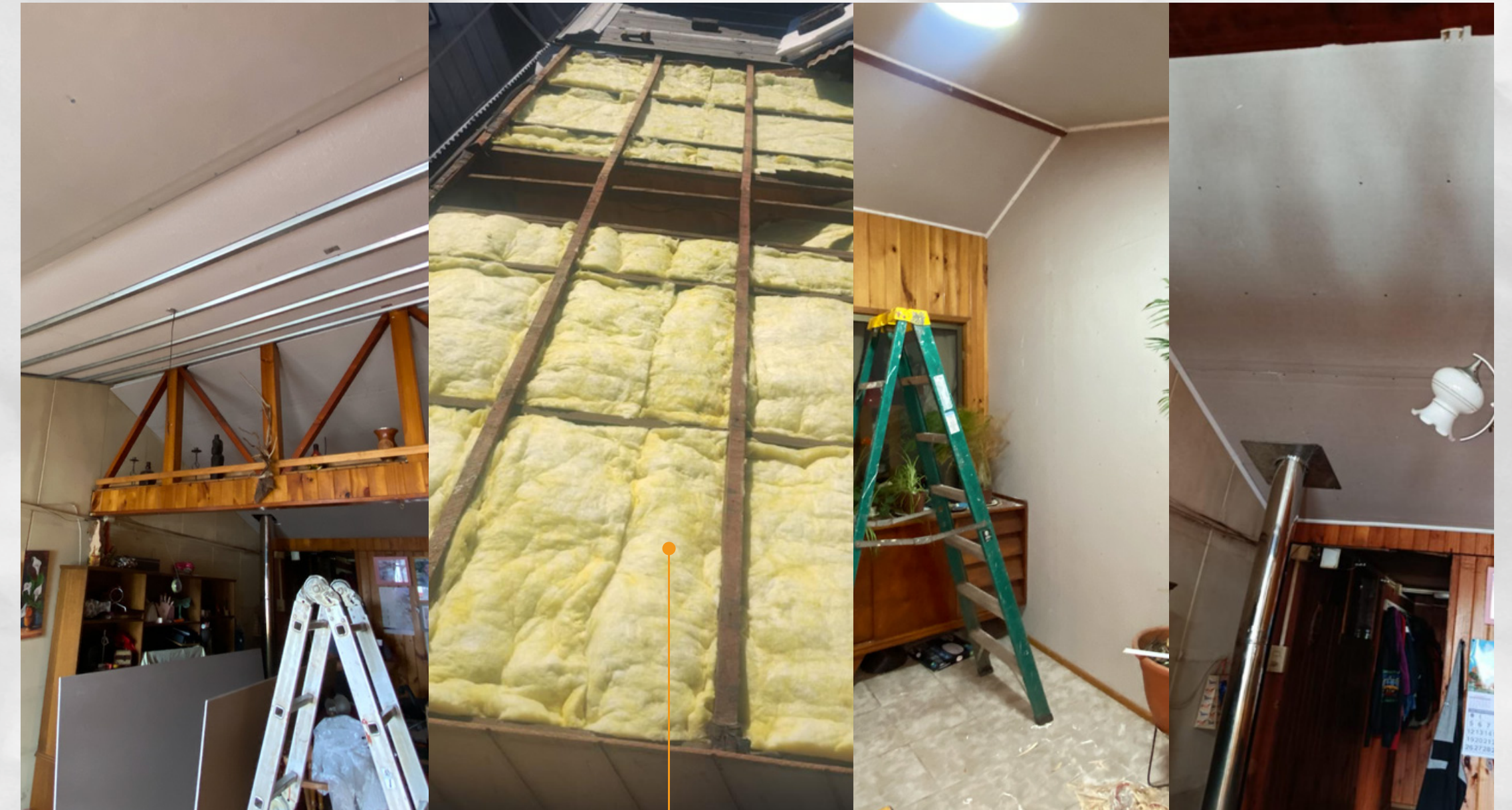
Solución aislación techumbre con tijerales