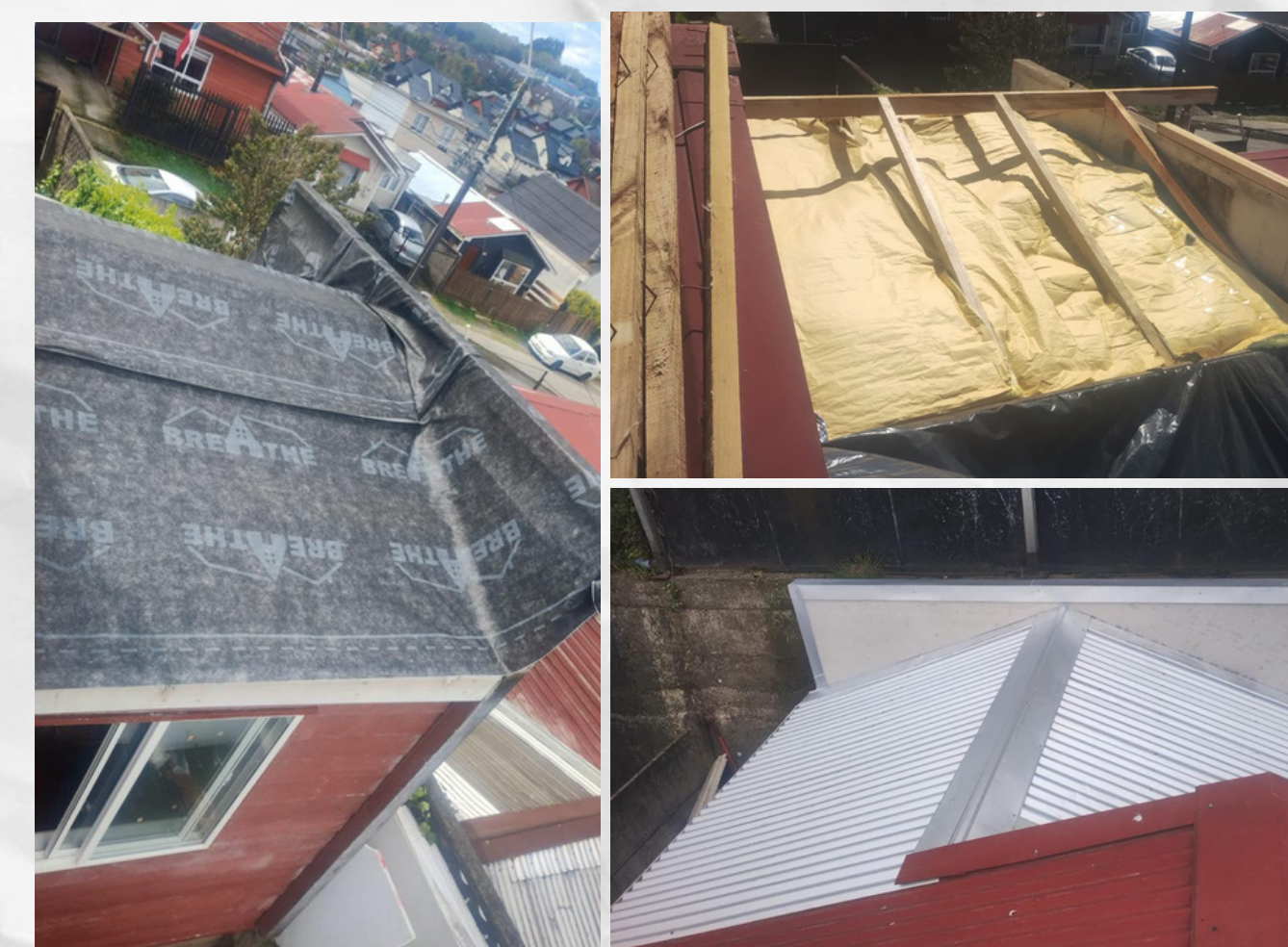
Mejoramiento estructura de techumbre y cambio cubierta