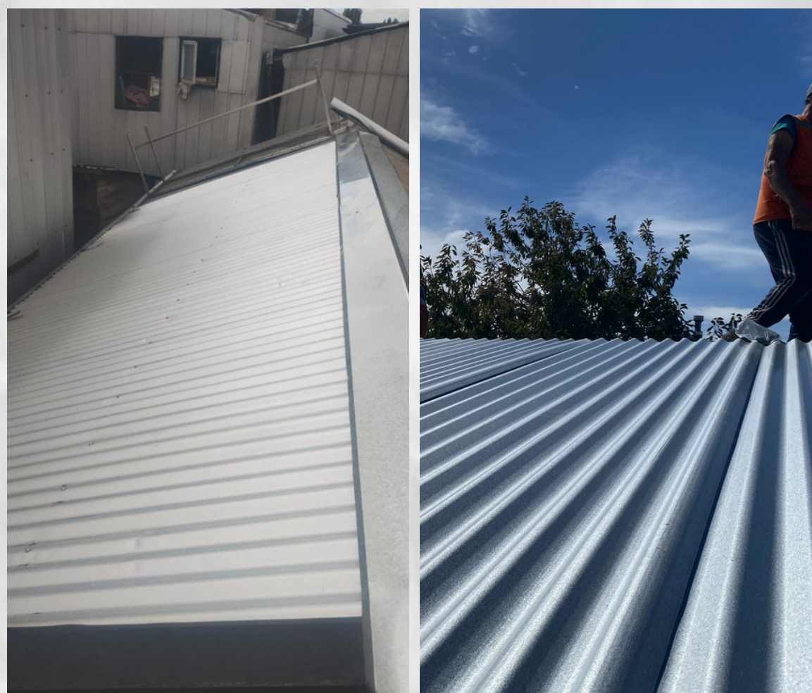
Cambio cubierta zinc-alum st. 0,35mm