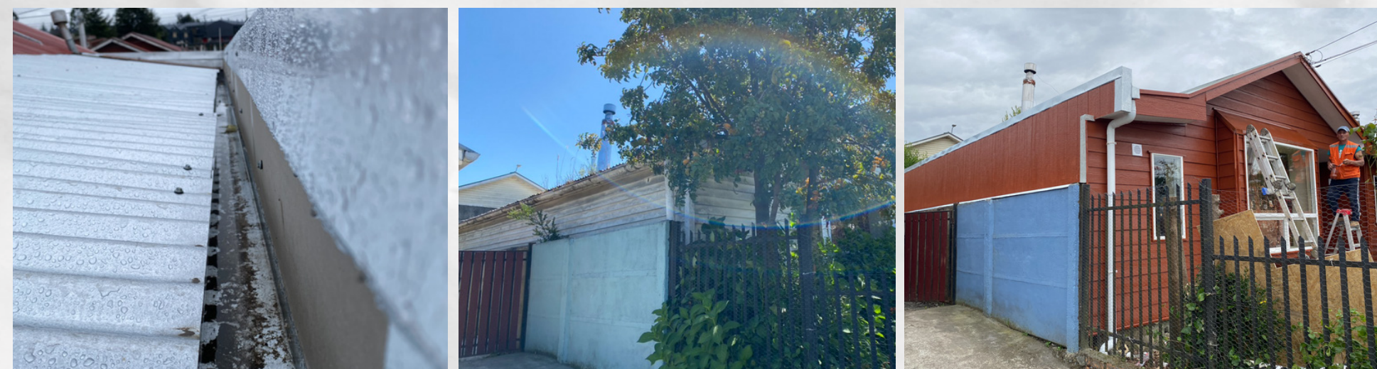
Regularización: Muro adosamiento F-60