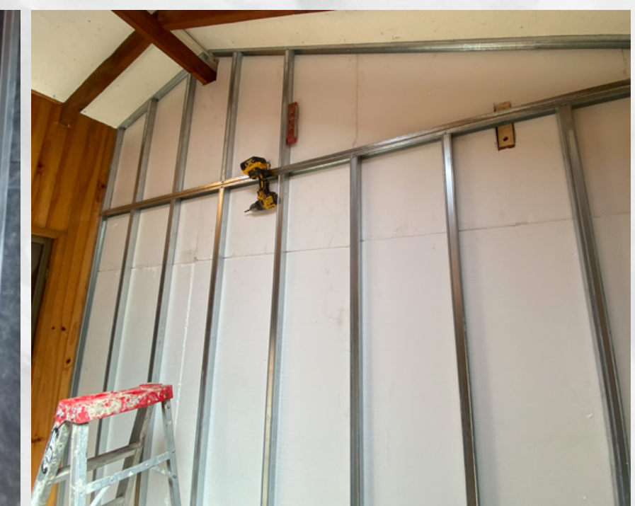
Solución aislación tabiquería perimetral