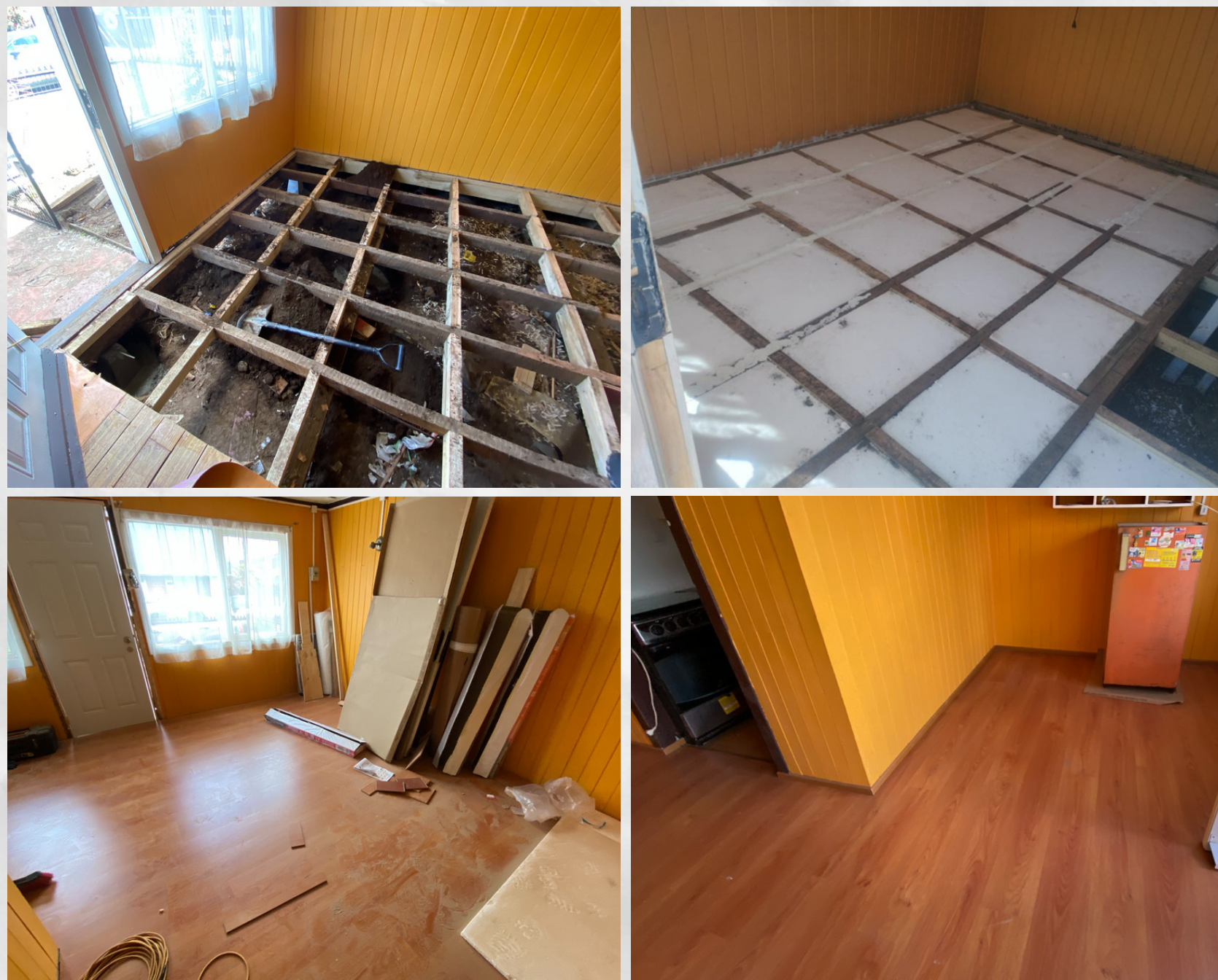
Solución aislación piso ventilado