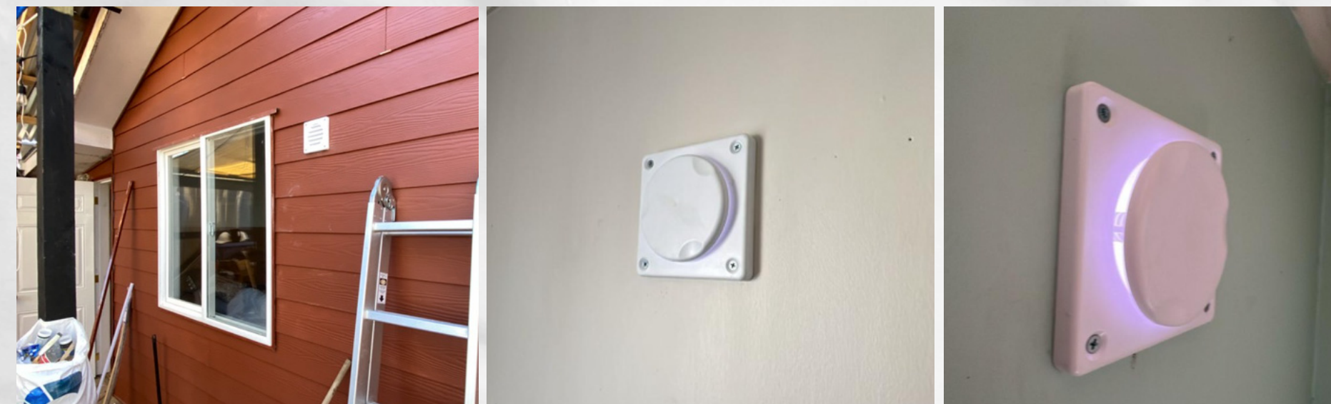
Sistemas de ventilación pasiva