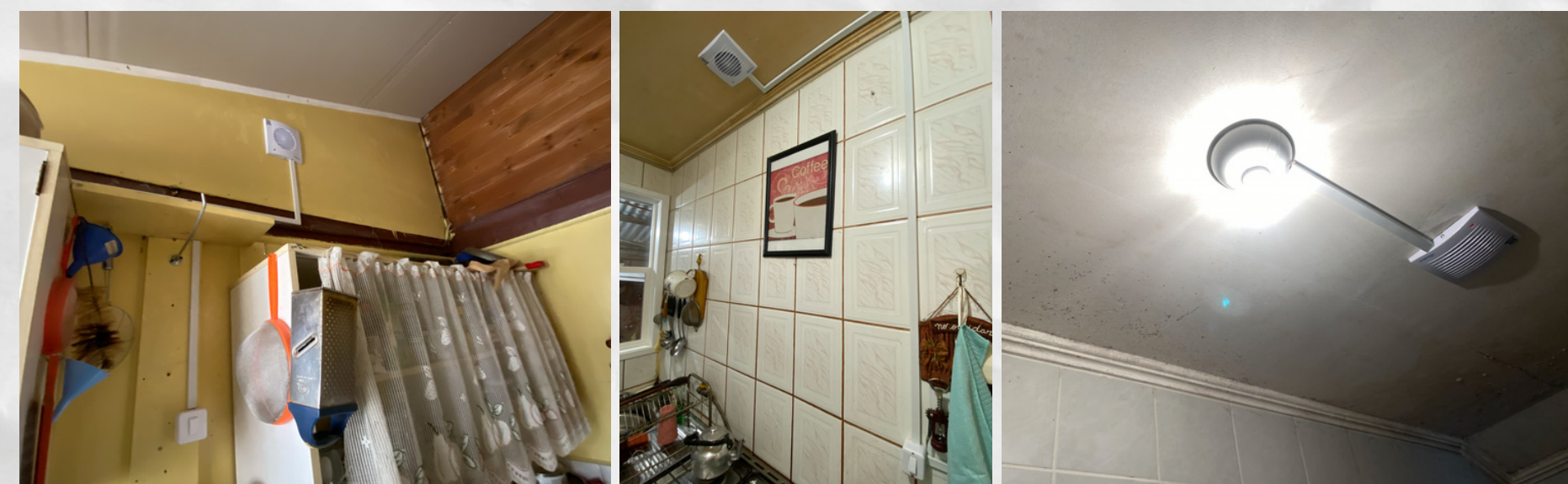
Sistemas de ventilación forzada